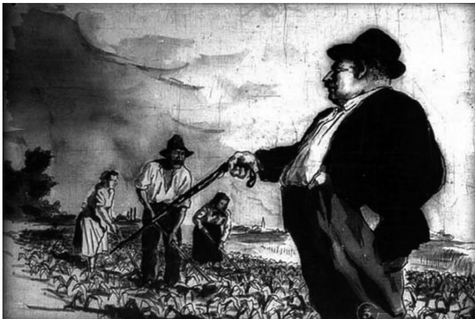
3. kép „Ádáz ellenségünk a kulák!”

és testi adottságai között. (3. kép) A diafilm szövege szerint a kulákok „[...] parasztok és éhező munkások vérén híztak kövérré.” 49