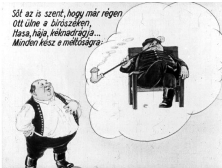
4. kép Bajusz, 1954. Diafilm Arany János költeményéből

szintjén jelenik meg azáltal, hogy Szűcs György alakja, testalkata és ruházata minden részletében a kulákellenes karikatúrák ábrázolásmódja szerint készült el (4. kép). Takács Róbert a Ludas Matyi satirikus hetilapban 1949–1956 között megjelenő politikai karikatúrákat elemezve az állandó figurák szerepeltetésére és azok jellegzetességeire hívta fel a figyelmet: a Kulák, Zsíros gazda, Hájás gazda rendszerint köpcös, kövér, harcsabajszú, pipázó alak, aki fekete csizmát, kalapot visel, tekintete aljas és rosszindulatú (TAKÁCS, 2003, 53–55., vö. HUHÁK, 2013, 83.; TÓTH, 2016, 649–650.).